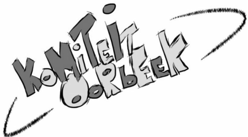
Bedankt Lore voor dit prachtig ontwerp.